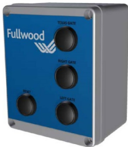
手動式オーバー ライドボックス