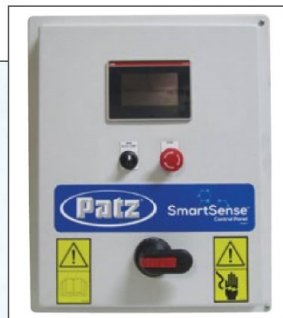
コントロールパネル