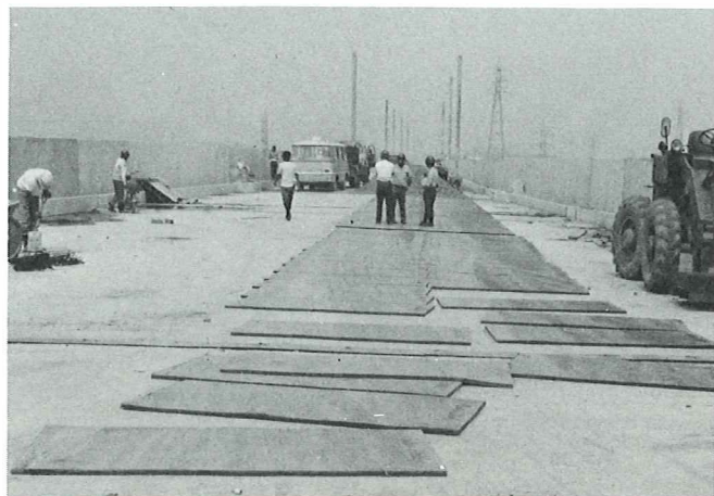
国鉄新幹線のレールの下に敷かれるウルトラマット

新幹線列車の重量と振動を支える丈夫さとクッション性が牛床マットに生かされています。上からの加重に特に強く、伸び・凹み等の変形がほとんどありません。