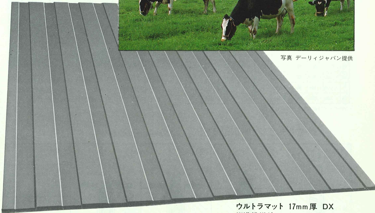
ウルトラマット 17mm厚 DX 縦溝模様付